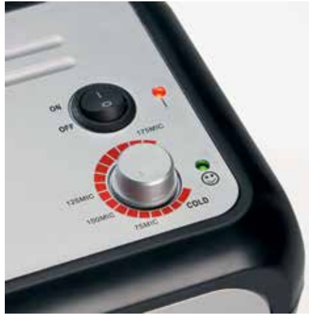
Ajuste individual de la temperatura para un resultado perfecto