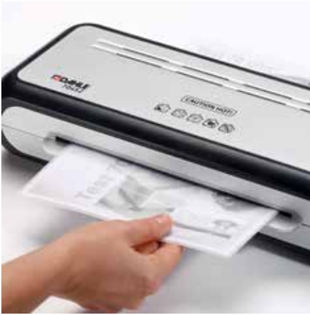
Plastificado confortable en un abrir y cerrar de ojos pasando la funda